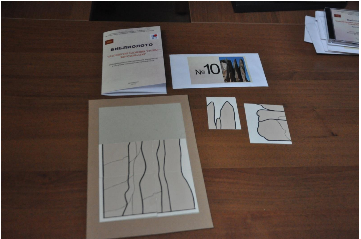
4.4. Схема сборки картинка-пазла на большой карте с ограничителем