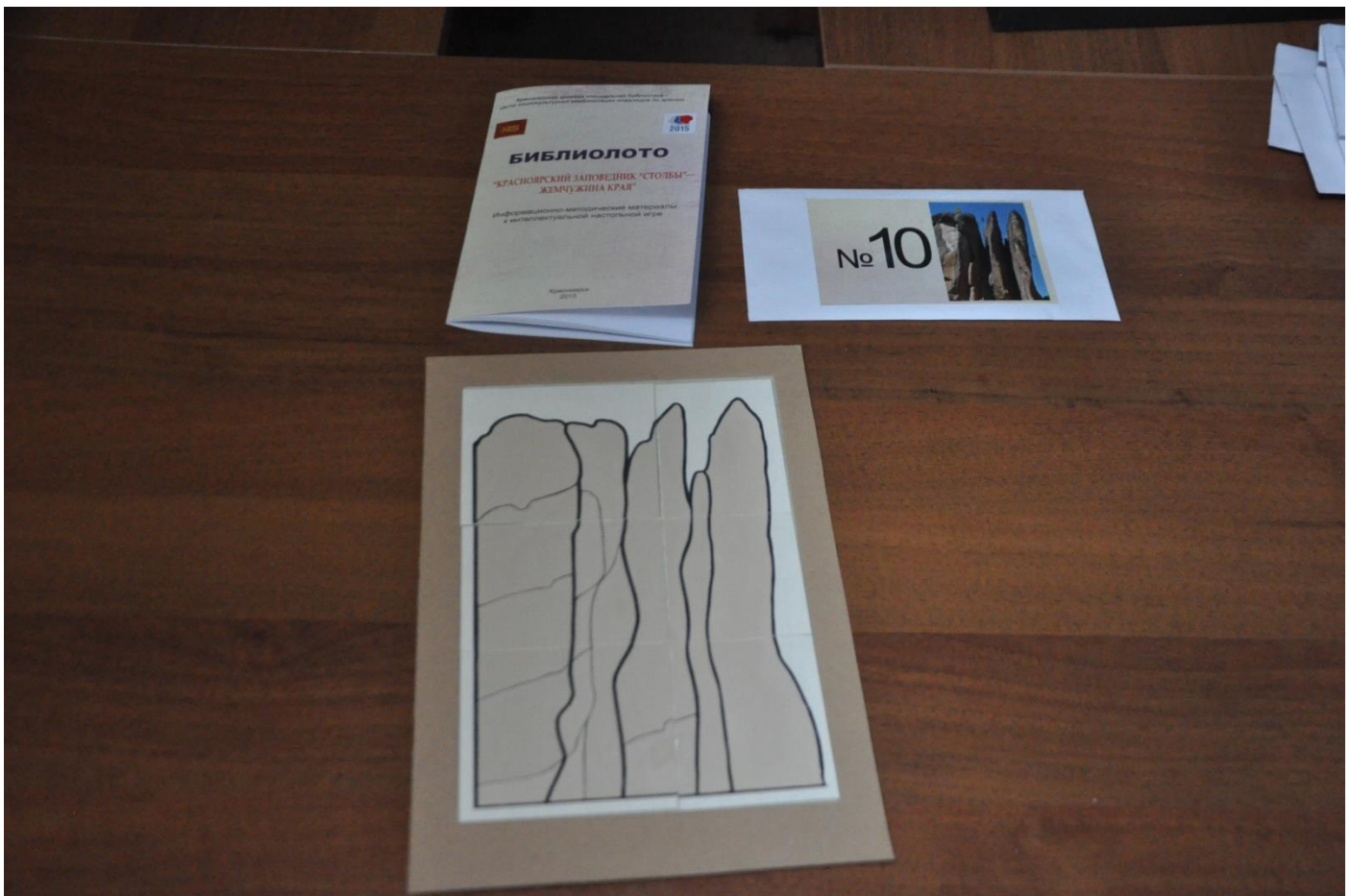
4.6. Схема сборки картинка-пазла на большой карте с ограничителем