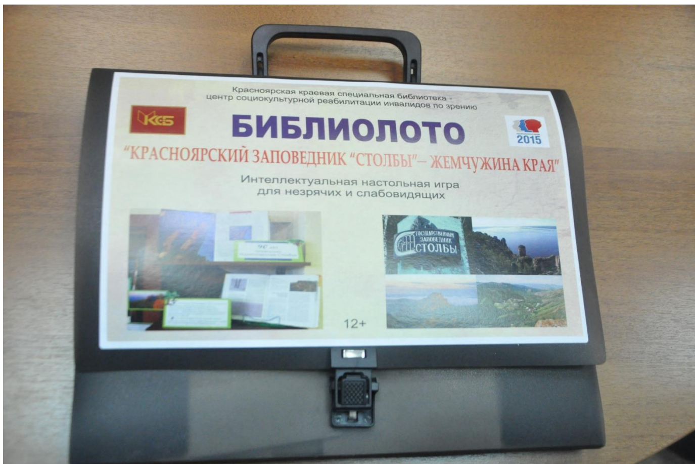
1. Общий вид издания