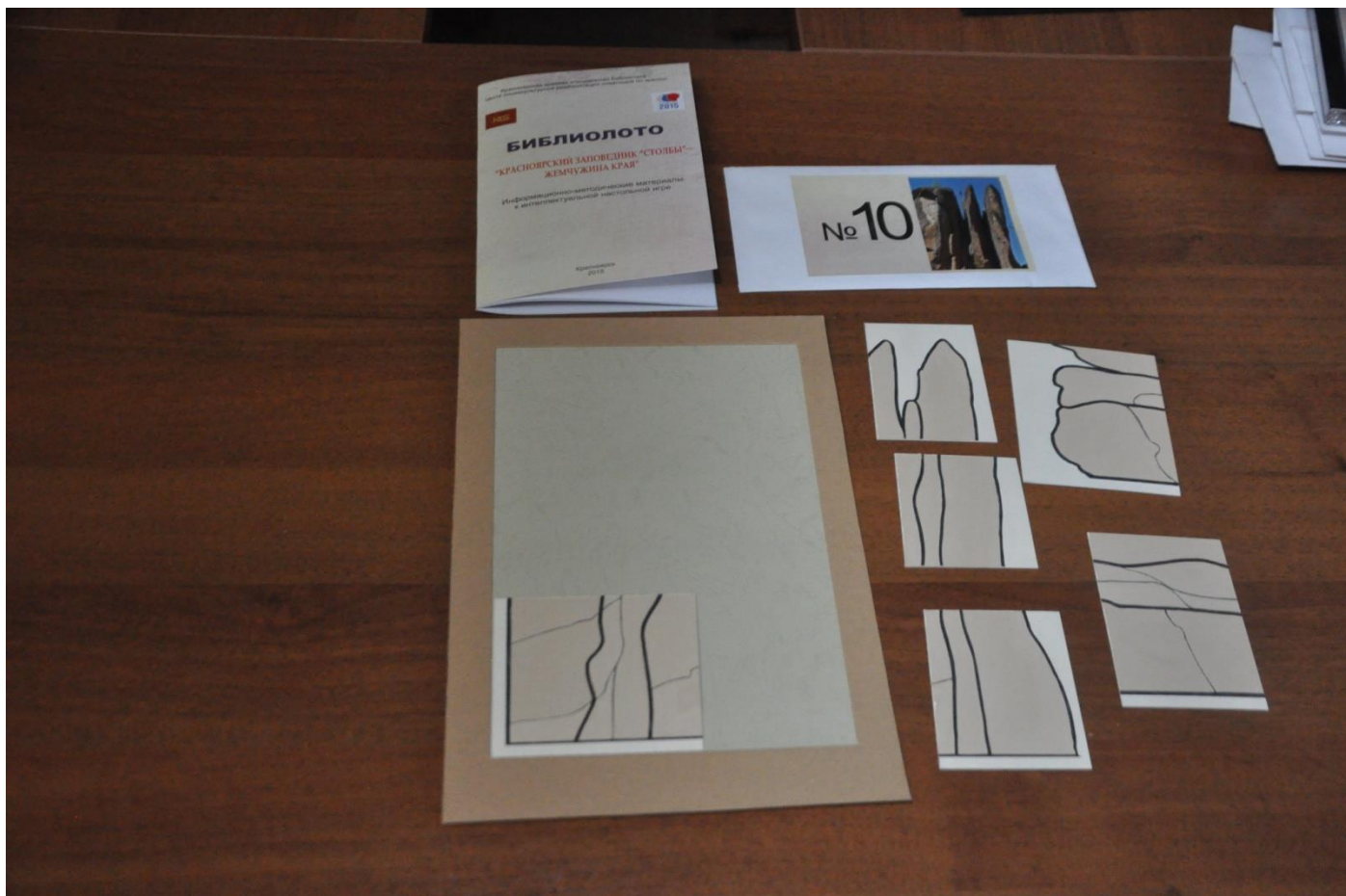
4.1. Схема сборки картинка-пазла на большой карте с ограничителем