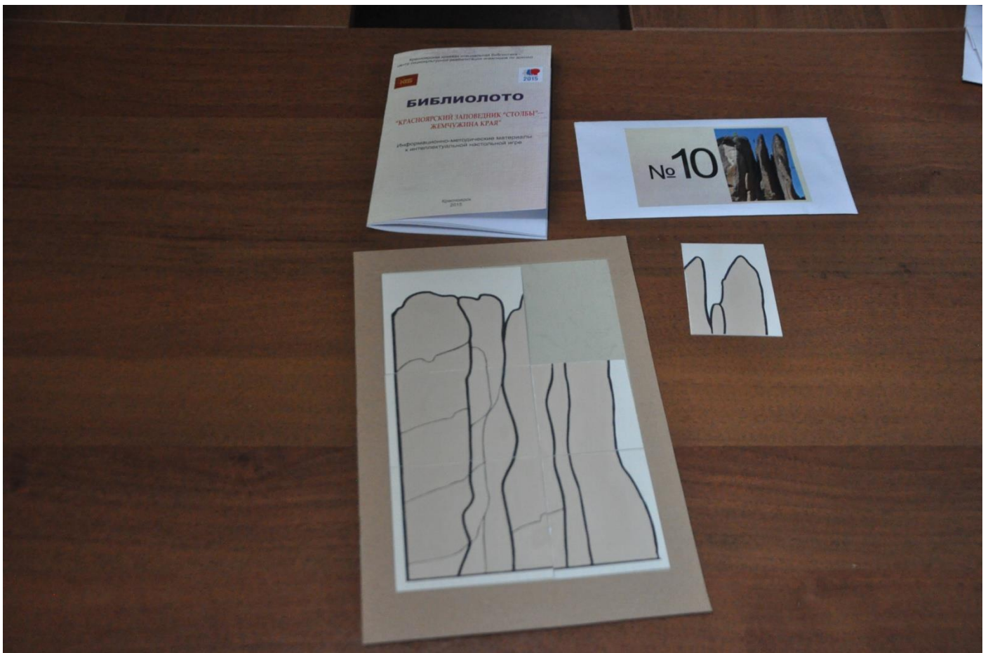
4.5. Схема сборки картинка-пазла на большой карте с ограничителем