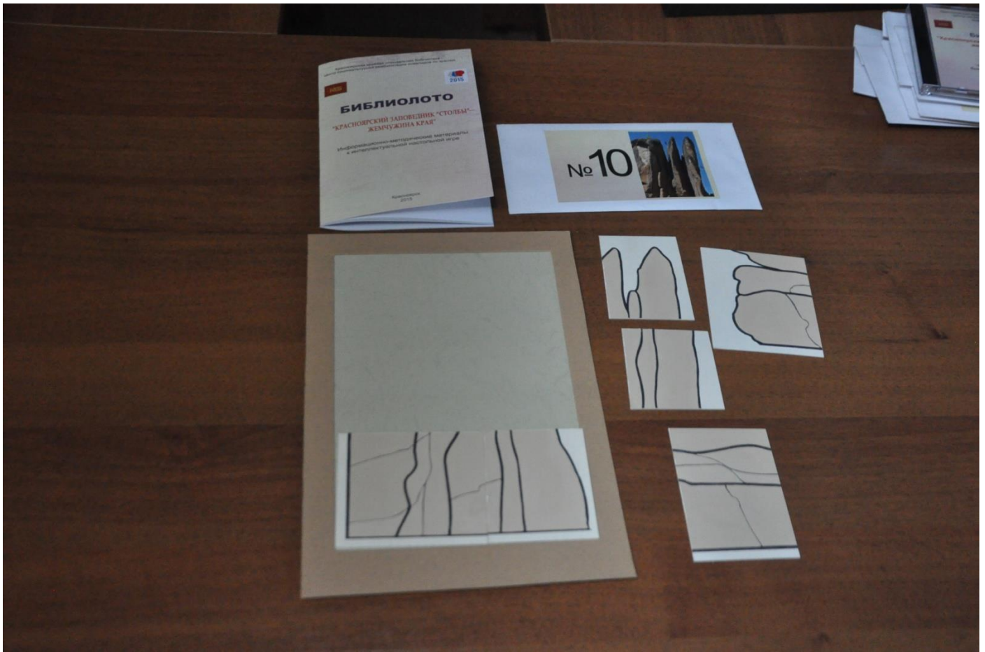
4.2. Схема сборки картинка-пазла на большой карте с ограничителем