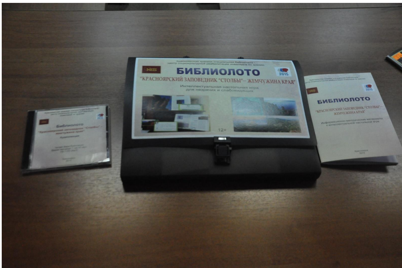
2. Аудиолекция и информационно-методическое пособие, входящие в издание