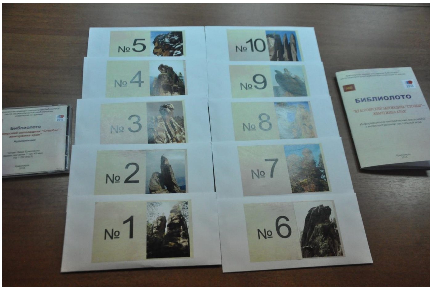
3. Конверты с рельефно-графическими картинками-пазлами