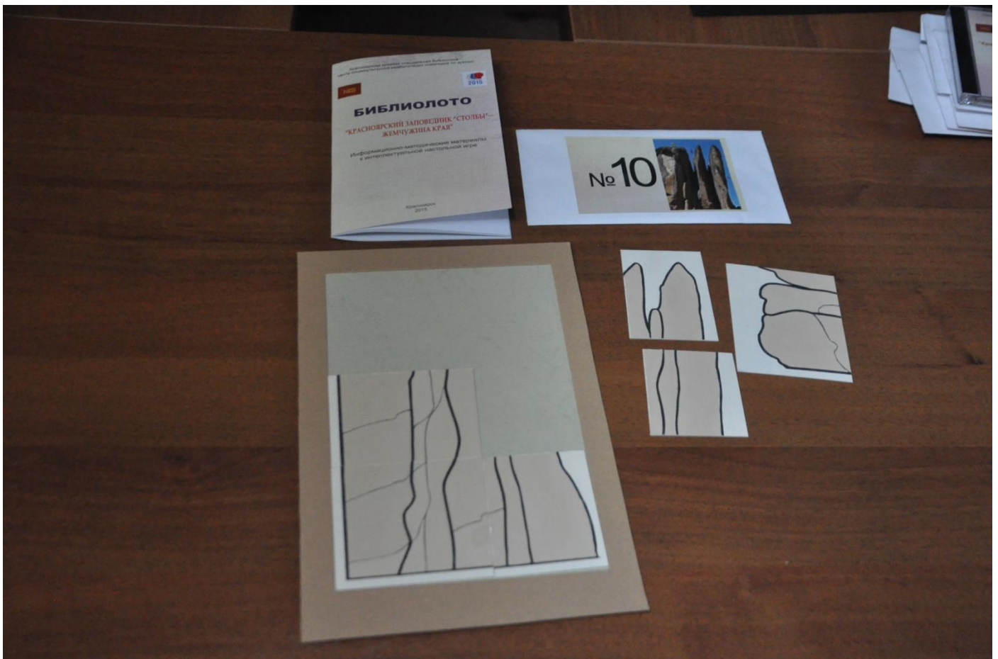
4.3. Схема сборки картинка-пазла на большой карте с ограничителем